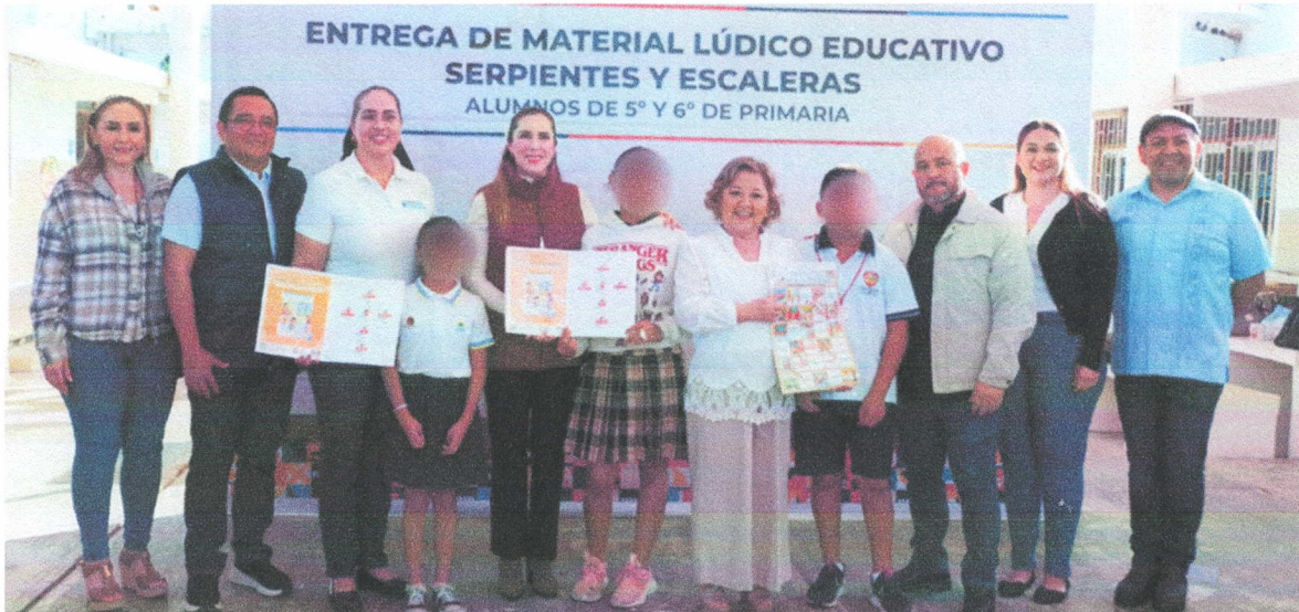
Entrega del juego-lúdico educativo Serpientes y Escaleras en el municipio de Isla Mujeres.

Asimismo, la Secretaría Ejecutiva, en compañía de la Secretaría de la Contraloría y la Secretaría de Educación, estuvieron presentes en la entrega de los juegos lúdicos en los municipios de Isla Mujeres, Felipe Carrillo Puerto y la localidad de Andrés Quintana Roo. I