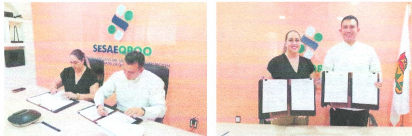
Imagen 3. Firma de convenios de colaboración administrativa.

Tipo de evidencia: Se adjuntan las imágenes de captura de la participación de la Secretaría Ejecutiva del SAEQROO a través de su titular con el Titular de la Contraloría Municipal de Tulum.