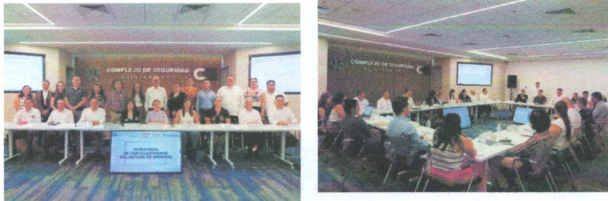
Imagen 5. Primera reunión de trabajo de la "Estrategia de Fortalecimiento del Estado de Derecho"

Tipo de evidencia: Se adjuntan las imágenes de captura de la participación de la Secretaría Ejecutiva del SAEQROO a través de su titular con diversas autoridades de la administración pública, representantes de la sociedad civil organizada, así como empresarios y activistas sociales que expresaron sus opiniones y propuestas.