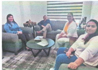
Imagen 1. Reunión de trabajo con el Órgano Interno de Control (OIC) del Municipio de Benito Juárez

Tipo de evidencia: Se adjunta la imagen de captura de la participación de la Secretaría Ejecutiva del SAEQROO a través de su titular con el OIC de Benito Juárez.