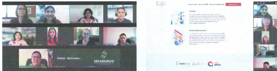
Imagen 4. Capacitación a personas servidoras públicas del Órgano Interno de Control (OIC) del Municipio de Puerto Morelos

Tipo de evidencia: Se adjuntan las imágenes de captura de la participación de la Secretaría Ejecutiva del SAEQROO a través de su titular con el personal del OIC del Municipal de Puerto Morelos.