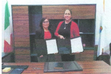
Imagen 7. Renovación de Convenio de Colaboración Administrativa con el TJAAQROO.

Tipo de evidencia: Se adjunta la imagen de captura de la participación de la Secretaría Ejecutiva del SAEQROO a través de su titular con la Magistrada Presidenta del TJAAQROO.