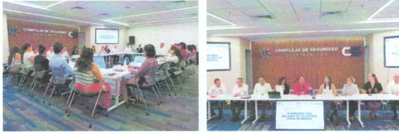
Imagen 6. Presentación del "Almanaque 2024: Balance de la Justicia Penal en México"

Tipo de evidencia: Se adjuntan las imágenes de captura de la participación de la Secretaría Ejecutiva del SAEQROO a través de su titular con diversas autoridades de la administración pública y representantes de la sociedad civil organizada, que expresaron sus opiniones y propuestas.