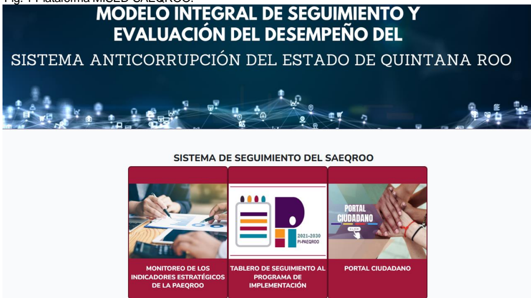
Fig. 1 Plataforma MISED-SAEQROO.