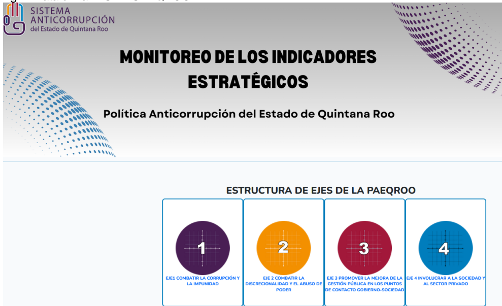
Fig. 1 Plataforma MISED-SAEQROO.