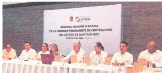
Imagen 2. Segunda Reunión Plenaria de la Comisión Permanente de Contralores del Estado de Quintana Roo.

Gracias al compromiso y coordinación con la Secretaría de la Contraloría del Estado, la SESAEQROO se dio a conocer formalmente el arranque, objetivos y alcance de este proyecto durante la Segunda Reunión Plenaria de la Comisión Permanente de Contralores del Estado de Quintana Roo , celebrada el 19 de julio del año en curso en la ciudad de Cancún , con la cual se logró coordinar la logística para calendarizar una agenda de trabajo con los Órganos Internos de Control del Poder Ejecutivo para la formulación de una encuesta en línea, entrevistas a grupos focales y entrevistas especializadas que permitan identificar y abordar las necesidades y realidades del servicio público, lo que facilitará un seguimiento más efectivo, resaltando que esta cooperación proporcionará una herramienta de Inteligencia interinstitucional de gran valor a largo plazo.