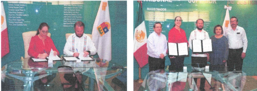
Imagen 1. Firma del Convenio de Colaboración Administrativa con el Poder Judicial del Estado de Quintana Roo para la Interconexión e Interoperabilidad con la PDN.

Gracias al trabajo coordinado y suma de voluntades se podrán establecer los mecanismos de colaboración para brindar asesoría y acompañamiento técnico que permitan la gestión y transmisión de información que genere el Poder Judicial para ser incorporada al sitio central de Datos de la SESAEQROO para su interconexión con la PDN.