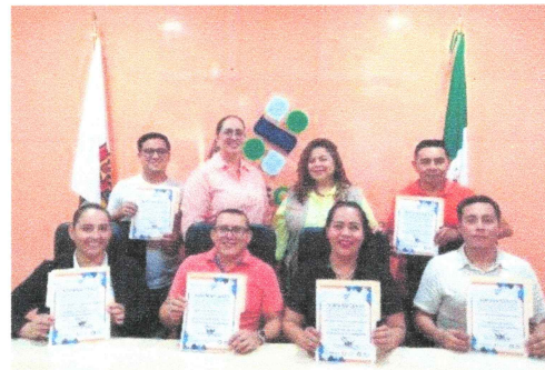
Imagen 5. Primera Sesión Ordinaria de Instalación del Comité Institucional para la Igualdad de Género (CIIG) de la SESAEQROO.