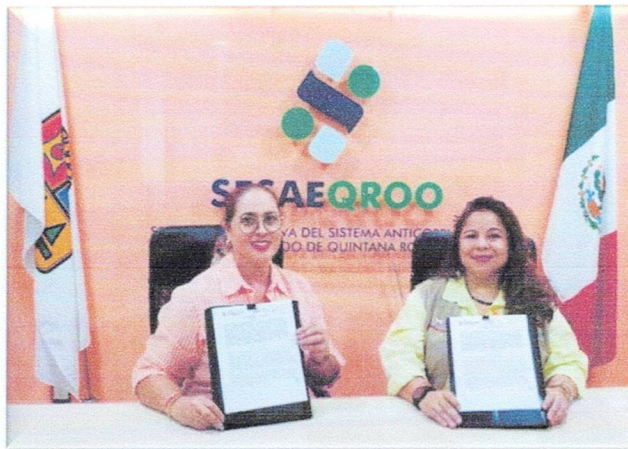
Imagen . Firma del Convenio de Colaboración con el IQM

25/09/2024: Firma del Convenio de Colaboración con el Instituto Quintanarroense de la Mujer (IQM), con el objetivo de coordinar acciones que garanticen e integren la perspectiva de género y fortalezcan el combate a la corrupción.