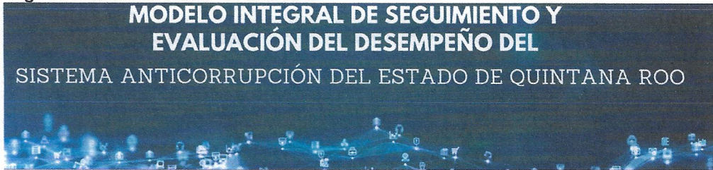
Fig. 1 Plataforma MISED-SAEQROO.