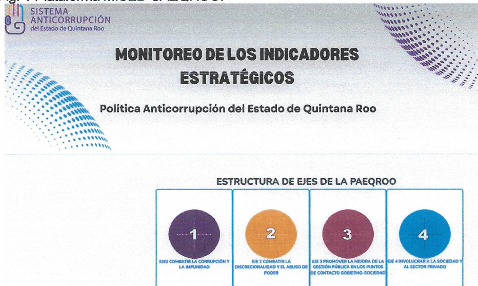
Fig. 1 Plataforma MISED-SAEQROO.