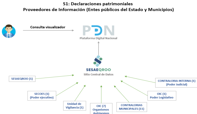
Proceso de interconexión e interoperabilidad de los proveedores de información del Sitio Central de Datos y la Plataforma Digital Nacional

La Secretaría Ejecutiva del Sistema Anticorrupción del Estado de Quintana Roo (SESAEQROO) para poder operar en el Sistema 1, es necesario integrar, conectar e interoperar con los proveedores de información, a través del Sitio Central de Datos del Sistema Local de Información hacia la Plataforma Digital Nacional (PDN), previa firma de convenio de los participantes (Entes Públicos Estatales y Municipales).