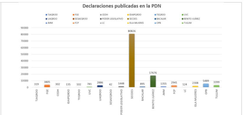
De las 124,843 declaraciones patrimoniales publicadas en la PDN se muestra la participación de la Secretaría de la Contraloría como el máximo proveedor de información; disponible para su consulta en https://www.plataformadigitalnacional.org/declaraciones

El proceso de interconexión de los entes públicos al Sistema 1, inicia desde la atención de la solicitud hasta la conexión con la PDN, el cual se muestra a través del siguiente semáforo de interconexión.